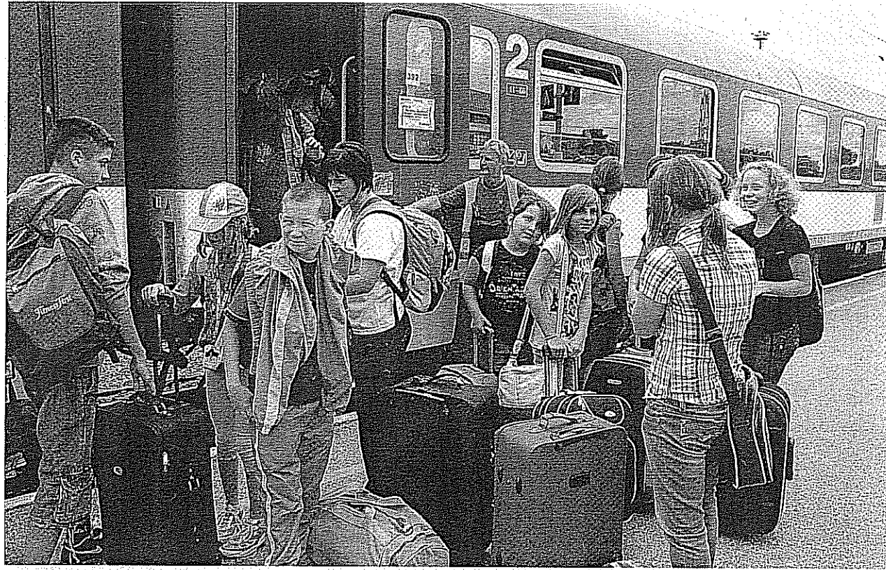
Szikszóról, a Miskolctól tizenhét kilométerre fekvő városból érkeztek tegnap a diákok Pécsre, hogy egy hetet eltöltsenek Baranya megyében

SEGÍTSÉG Borsodi gyerekek érkeztek Baranyába kikapcsolódni